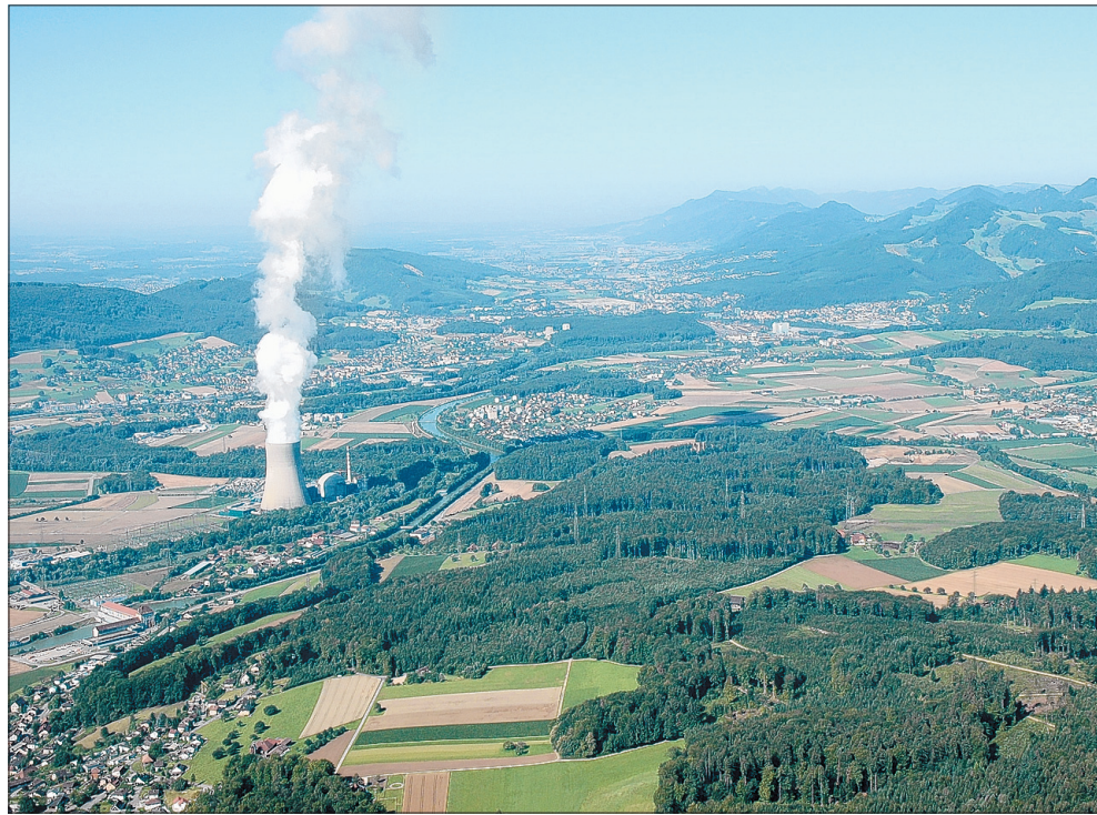
NIEDERAMT Neben dem AKW Gösigen könnte ein atomares Endlager hinzukommen.