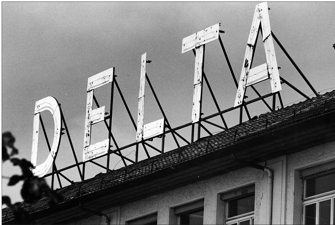
MARODE Seit der 1970er-Krise haftete Solothurn das Image als «Rezessionskanton» an – verschiedene Uhren- und ihre Zuliefererfirmen wie die Delta-Werke in Langendorf schlossen damals ihre Tore. ARCHIV SZ

Der Regierungsrat erachtete es für dringend, sofortige Massnahmen einzuleiten. Er setzte 1975 ein Wirtschaftsgremium als sein Beratungsorgan ein («Wirtschaftsrat», heute «Beirat der Wirtschaftsförderung») und