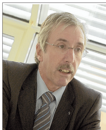
ROLAND BORER Oder soll es der SVP-Nationalrat sein? OM