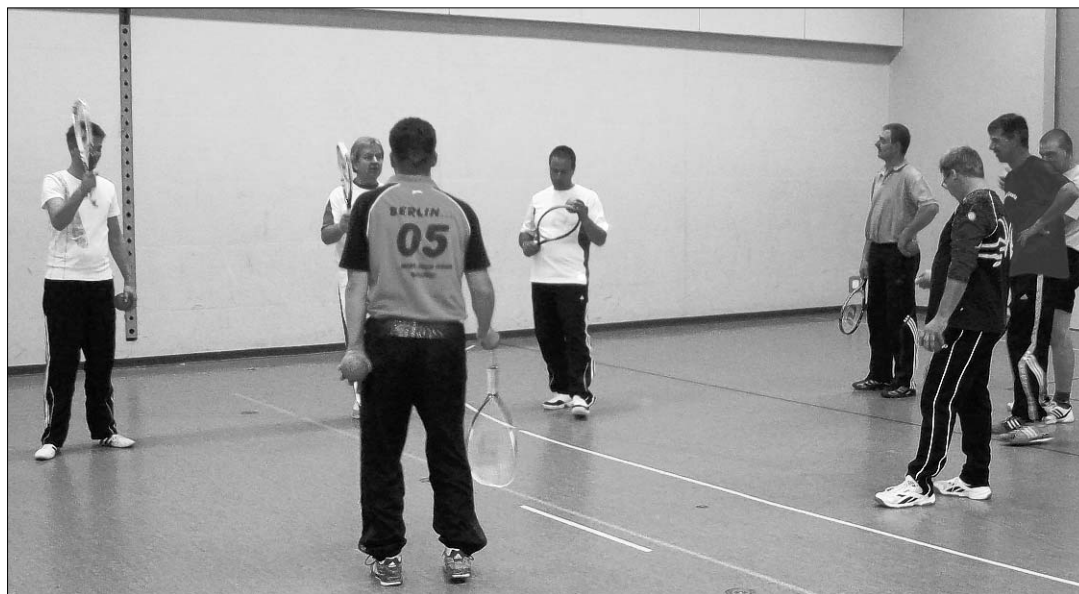
UP TO DATE Smolball wird nun auch in den Turnhallen Härkingens gespielt.

len. Die diesjährige Erzählnacht lebte nicht nur von den spannend erzählten Geschichten, sondern auch von der besonderen Atmosphäre, welche die Lehrpersonen in ihre Schulzimmer zauberten, um die Kinder in ihre Geschichtenwelt zu entführen. Auch das Lesen in der Bibliothek mit der Taschenlampe war ein voller Erfolg. Wegen der grossen Anfrage wurde auch die Aula zum Leseraum umfunktioniert. Die Kinder lagen auf Decken und leuchteten in ihre Bücher. Es war eine ungewohnte Stille, die man in der Gegenwart so vieler Kinder nur selten antrifft. Das Ziel der Erzählnacht, Kinder für Geschichten und für's Lesen zu begeistern wurde mehr als erreicht. Denn die Erzählnacht in Däniken endete mit Lesen. (NT)