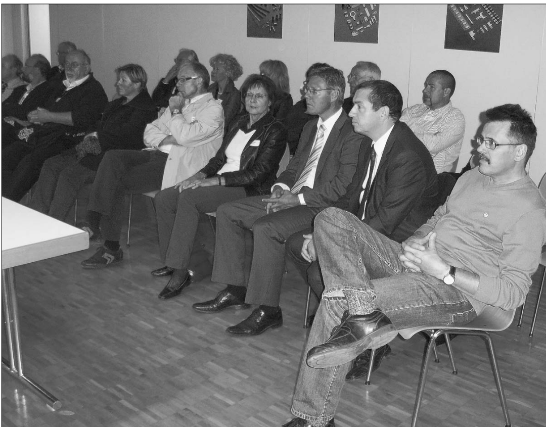
AUFMERKSAM Die CVP-Arbeitspartei bei der Firma Vogt AG Verbindungstechnik