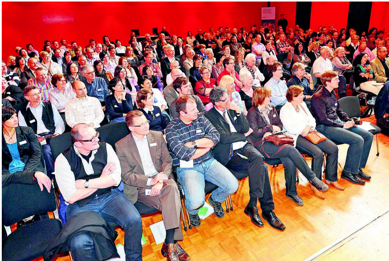
Gegen 200 Personen waren gestern im Oltnere Stadttheater beim 5. Aare-Forum mit dabei.

Gastredner Carl Just sprach hingegen über seine eigene ganz tiefe Krise. Er half sich über schlaflose Nächte mit exzessiven Alkoholmissbräuchen hinweg und stürzte so über Jahre in ein Loch, aus dem ihm am Anfang niemand zu helfen wusste. Wie er erzählt, haben ihn Ärzte und Psychotherapeutin als Alkoholiker abgestempelt. Wenn er von seinen Alpträumen und den schrecklichen Bil-