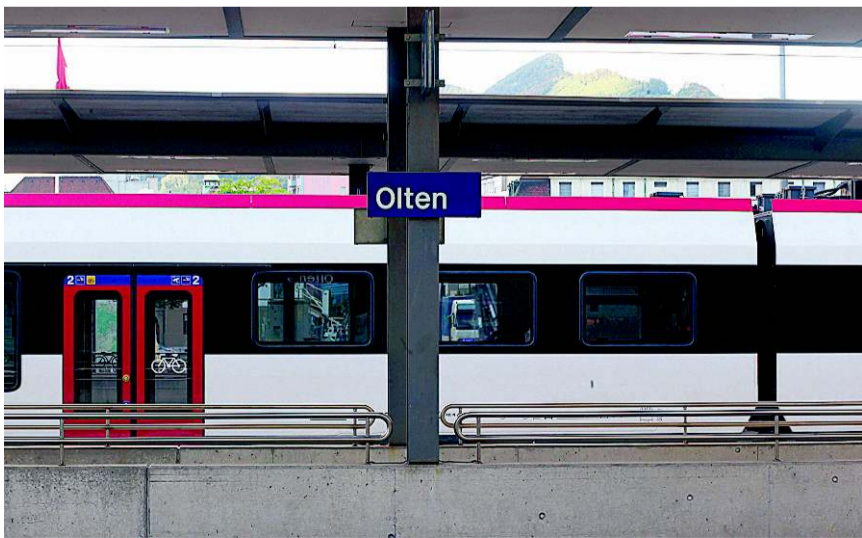
«Fundort» Bahnhof Olten: Dank aufmerksamer Pendler konnte der «verlorene Sohn» der Familie übergeben werden.

Herzerweichende Szene am Montagmittag um 16.55 Uhr am Bahnhof Olten: Dutzende Pendler warten im südwestlichen Teil des Bahnhofs auf den Zug Richtung Biel, als gegenüber auf dem Perron beim Gleis 2 plötzlich ein blonder Junge laut schreit. Vor seinen Augen fährt soeben der Interregio nach Konstanz ab. Einige Pendler reagieren sofort und springen durch die Unterführung auf den betreffenden Perron,