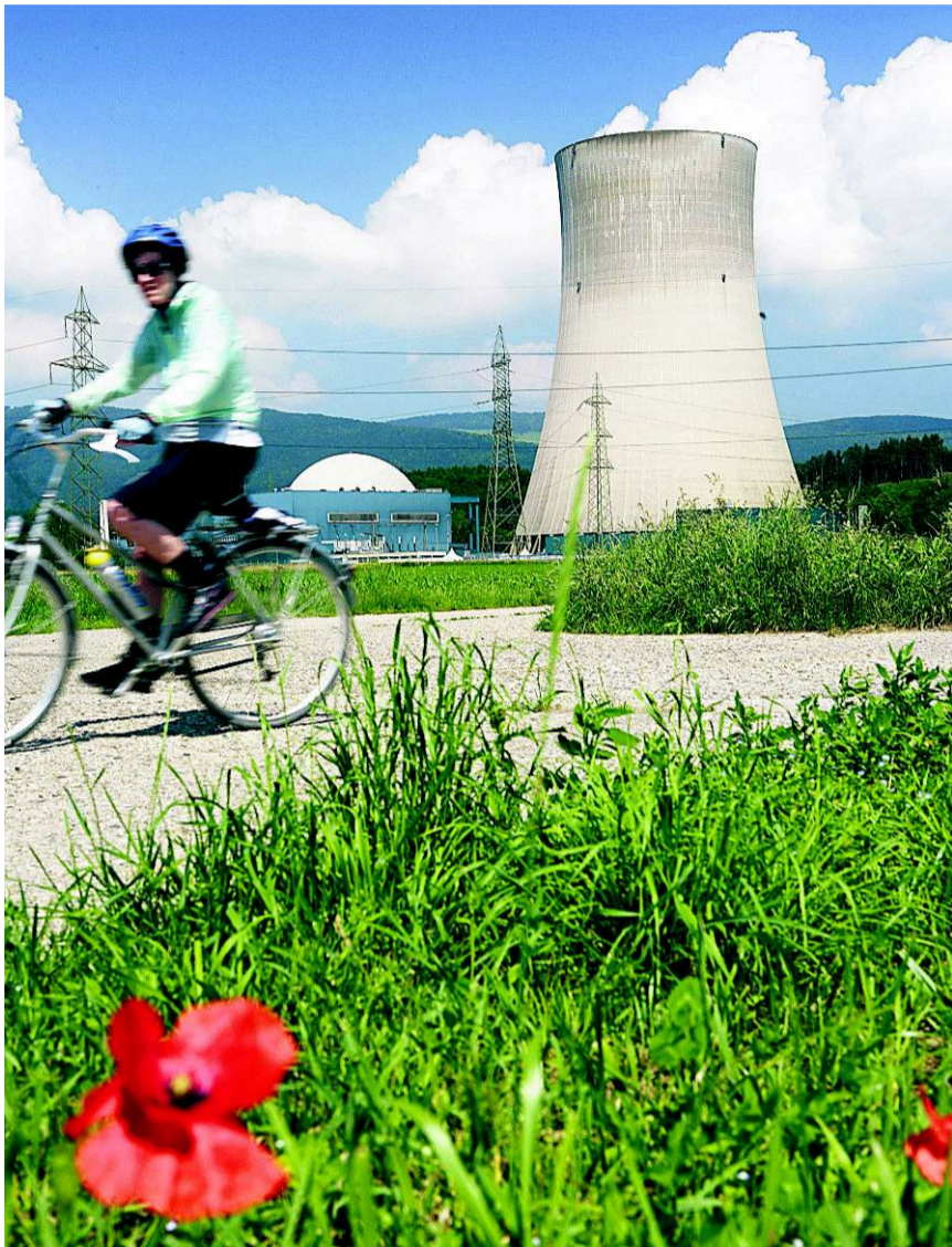
Abkehr von der Atomenergie? Der Regierungsratsentscheid lässt auf sich warten.

Nächsten Dienstag, so Eng, werde der Verabschiedung der energiepoli-