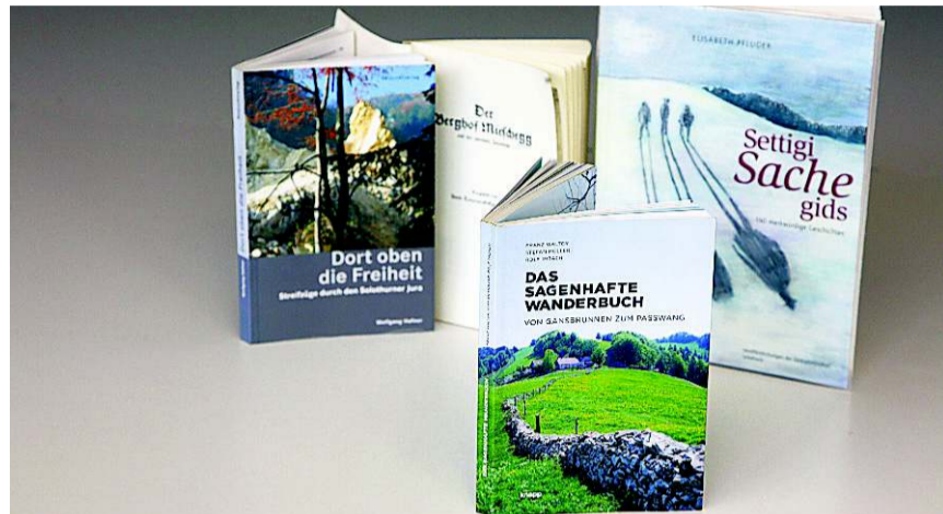
Im Buch «Das sagenhafte Wanderbuch» sind Abschnitte aus fremden Büchern abgeschrieben. Quellen werden keine genannt.