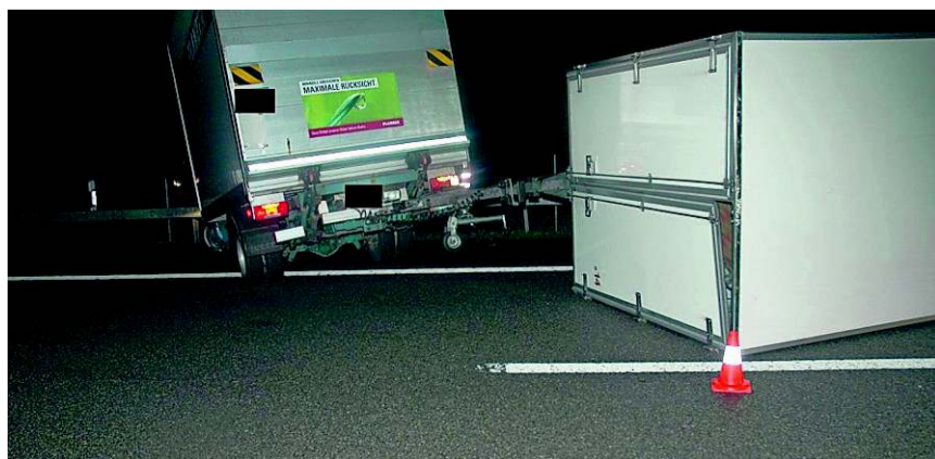
Der Lieferwagen knallte in die Leitplanke, der Anhänger kippte. PKS

kippte zur Seite und das ganze Gefährt blockierte folglich den Pannen- und Normalstreifen. Verletzt wurde niemand. Wegen der Bergungs- und Aufräumarbeiten bildete sich bis gegen 8.30 Uhr entsprechender Rückstau. Gaffer verursachten in der Gegenrichtung ebenfalls Stau. Da viele Verkehrsteilnehmer dem Stau auswichen, stockte der Verkehr auch auf der Hauptstrasse zwischen Oensingen bis Wangen an der Aare. (SZR)