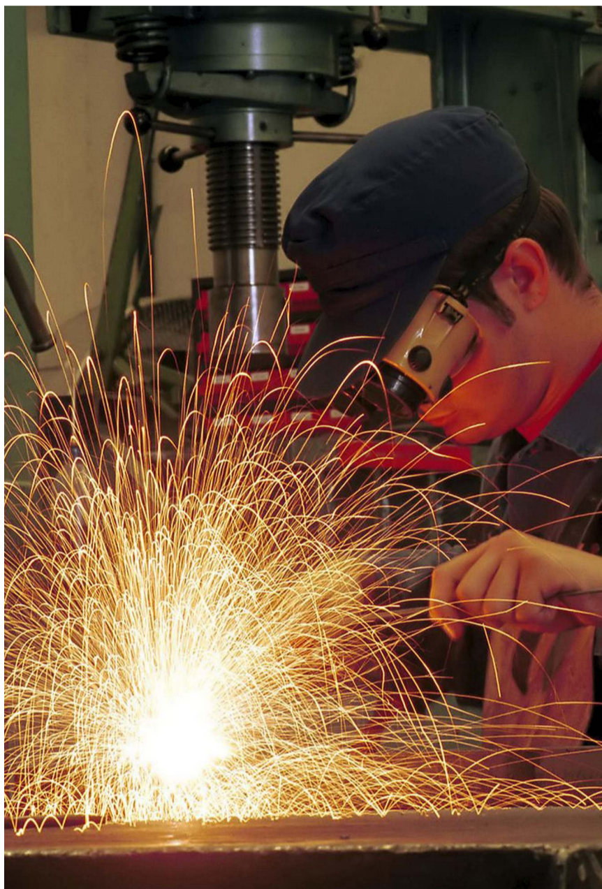
Noch sprühen die Funken in der Solothurner Industrie. Aber die Abschwächung schlägt langsam auf den Arbeitsmarkt durch.